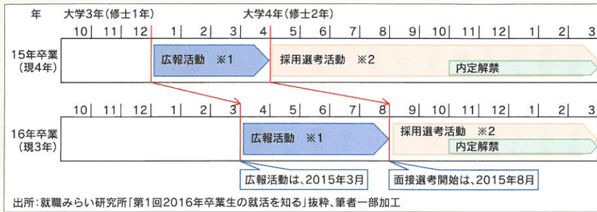
図1 就職活動スケジュール新旧対照表

順に説明会、選考試験、合否判定まで行い、4年生の4月の採用選考活動以前に内々定といって内定を約束する企業はありました。大手企業の中には5月上旬以降、その後、地元企業が内々定を出すという状況でした。